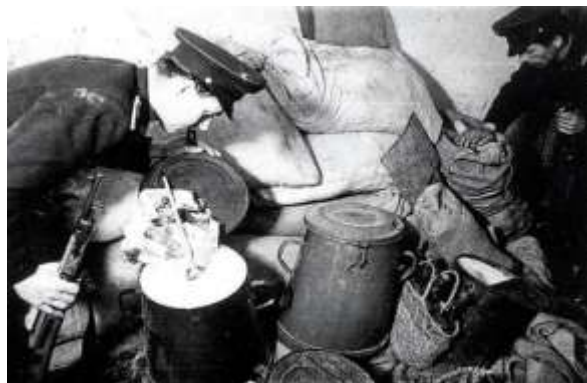
A rendőrök elrejtett termények után kutatnak egy „kulák” kamrájában, 1951. március. 15