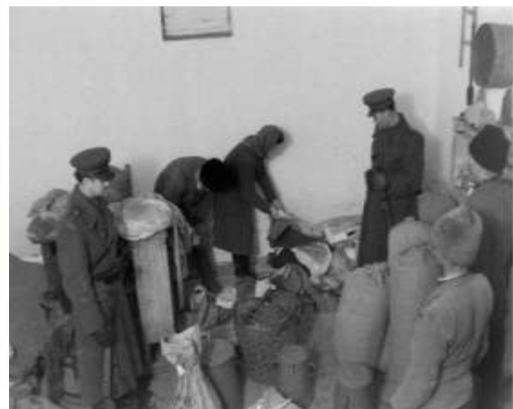
A mezőgazdasági termények beszolgáltatása 14