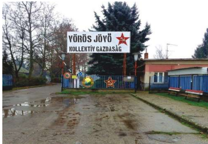
Kollektivizálás Háromszéken 13

A rendszerváltozást követő években a közszolgáltatási körön kívül eső vagyontárgyak nagy része ismét magántulajdonba került, s az 1990 utáni kormányzatok az államosítás korábbi kárvallottjait igyekeztek részlegesen kárpótolni. 1992-ben a tartósan állami tulajdonban maradt vagyon kezelésére megalakították az Állami Vagyonkezelő Részvénytársaságot.