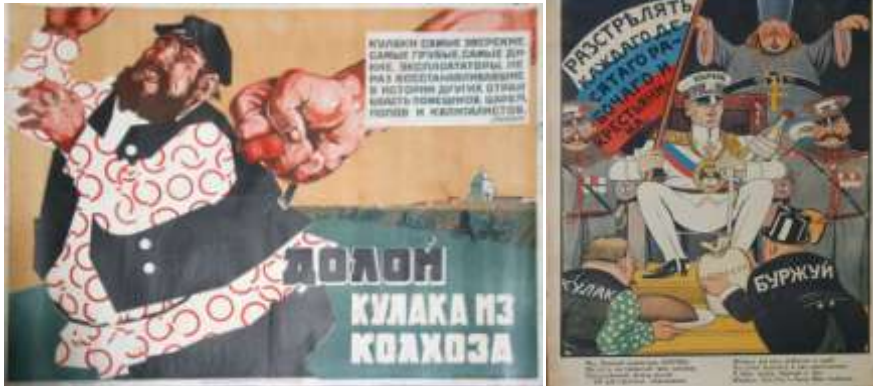
Lenin-idézet egy szovjet kulákellenes plakáton Kulákellenes szovjet propagandaplakát

így akarta bizonyítani, hogy az egyéni gazdálkodásnak nincs jövője, a parasztság számára csak a kollektivizálás a járható út. A mindenüktől megfosztott kulákok és leszármazottaik jelentős része az iparba menekült.