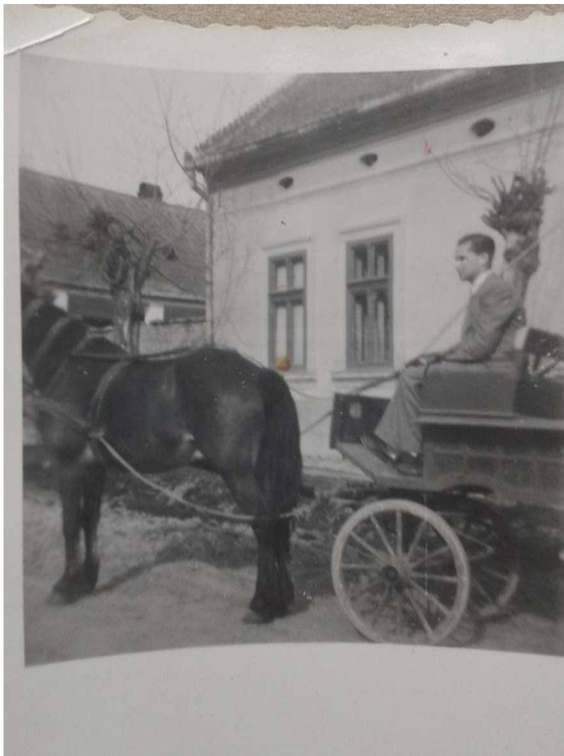
Szekszárd Kossuth Lajos utca 49.

A következő fotón a szekszárdi házunk látható a „bizonyos ablakkal”. 2