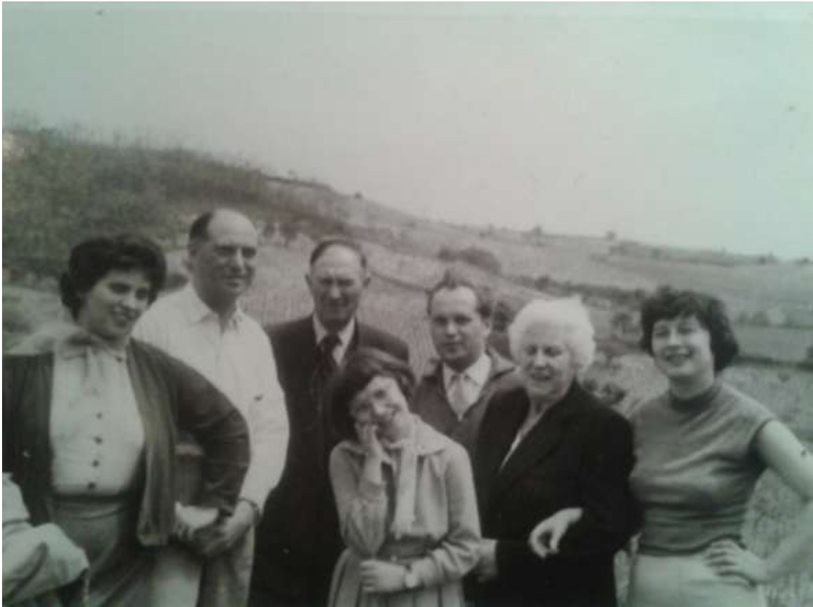
Család a Parásztán – Üknagyapa a képen balról a harmadik

Mára csak emlék a szép „Parásztá” 7 (amely Szekszárd egyik legjobb minőségű szőlőterülete volt) tanyával, földbe vájt pincéjével, rengeteg hordójával, prüssel, kádakkal, stb. (csatolt alábbi fénykép). A közös gazdálkodás ellehetetlenülését kénytelen kellett felismerve, méltatlan összegű havi földjáradékkal fizették ki üknagyapát. Ma ez a terület, amelyen kiváló díjnyertes borok teremtek, teljes egészében be van építve „csodálatos” palotákkal.