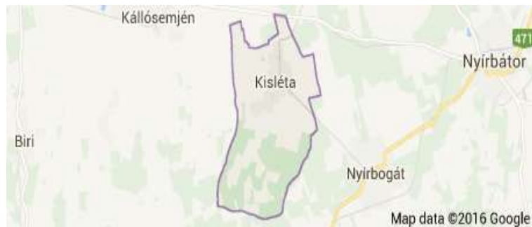
kép: 1. Kisléta területi elhelyezkedés

A település megközelíthető közúton, a 4-es Főúton Debrecenig, onnan tovább a 471-es főúton Nyírbogátig majd nyugati irányba 5,9 Km