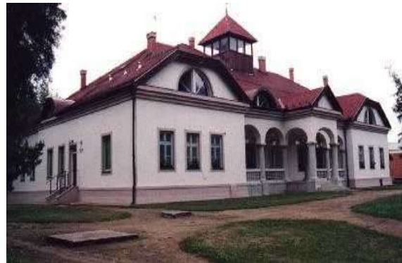
kép: 6. A Gencsy kastély mai állapota, Kislétai Gyermekvédelmi központ

10 naponként kellett hozni a pénzt, nagy bóröndökkel, mert nagyon sok pénzre volt szükség ahhoz, hogy egy ilyen szervezet eredményesen működjön. Fontos volt, hogy az emberek megkapják a béreiket és a megfelelő ellátásban részesüljenek az állatok és a földeken minden a megfelelő rendben menjen. Egy átlag dolgozó körülbelül 3000-Ft fizetést kapott egy hónapban, az irodai dolgozók többet, körülbelül 4500-5000Ft-t kaptak. A kifizetések az állattenyésztőkön kívül havonta 10 történtek, az állattenyésztők 10 naponta kaptak fizetést. Az ő fizetésük mindig változott annak függvényében, hogy hány hétvégét és ünnepnapot dolgoztak, mert minél több ünnepnapot és vasárnapot dolgoztak annál több volt a fizetésük. Akik a Gesztor Gazdaságba dolgoztak azok fizetése is magas volt. A Gencsy kastély a Tsz tulajdonában volt egészen addig, ameddig gyermeket nem csináltak belőle ahol sérült gyerekeket kezelnek és ápolnak a mai napig.