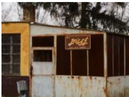
kép: 9. A Máriapócsi Mg-Tsz udvara

A közös Tsz-t 1994-ben számolták fel az akkori kormány intézkedése alapján.