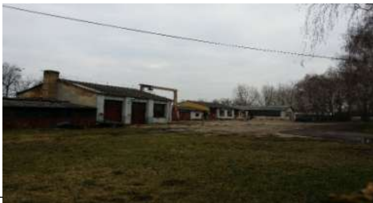
kép: 11. A Máriapócsi Mg-Tsz épületei mai állapotban