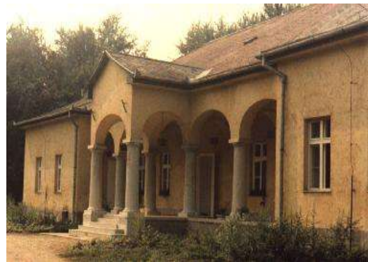
kép: 3. A Gencsy birtok főépülete

1960. március 1-én újból megalakult a szövetkezet. A falu munkaképes lakosságának 40%-a vissza lépett a szövetkezetbe. Megalakulást követően a terület nagysága 3800 hektár lett, aminek jelentős részét a Gencsy család adományozta. Ebből a területből 200 hektáron dohányt termeltek. A tagok elnöknek Mikó Jánost választották meg, főkönyvelőnek 7