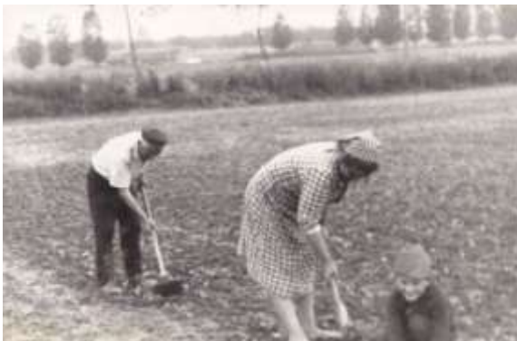
kép: 4.,5. A Tsz-i munkálatok (illusztráció)

A nyírbátori járás vezetősége javaslata alapján három község Kisléta, Máriapócs, Pócspetri szövetkezeteinek egyesülni kellett 1965-ben.