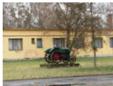
kép: 10. A Máriapócsi Mg-Tsz Büfé épülete