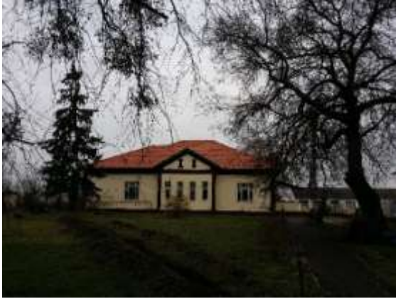
kép: 2. A Kislétai Mg-Tsz iroda épülete mai állapotban

indulni. A nyírbátori bankhoz kellett fordulni hitelért és kezdetlegesen voltak a munkagépek ahhoz, hogy megindulhasson a termelés.