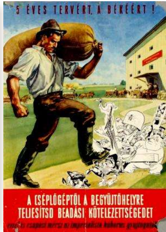
Képeken: propagandaplakátok az 50-es évek elejéből 18