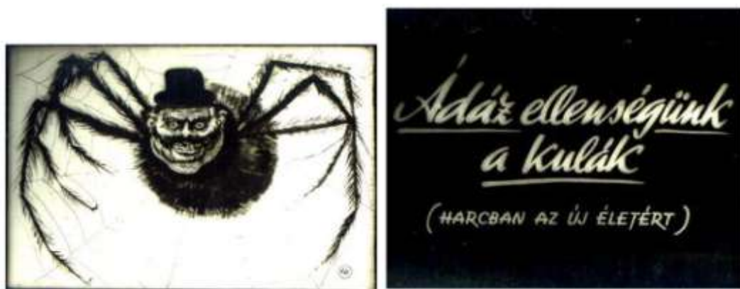
Képeken: kommunista rajz a kulákságról, mint pók, és nyílt gyűlölködő plakát 10

hogy mikor jönnek el értük az AVH- sok. Aki nincs velünk, az ellenünk van! – hangzott a jelmondat, miszerint bárkit, bárhol, bármikor elkaphattak. A parasztok egy része túrt és kitartott az őket sújtó diszkrimináció ellenére is, őket egy idő után elhurcolták, ha már nem tudtak teljesíteni, de voltak, akik öngyilkosságba menekültek. A beszolgáltatást el nem végző parasztokat „közellátást veszélyeztető bűncselekmény” címen ítélték el. 9 Nem volt ritkaság, hogy belehaltak a testi-lelki fájdalomba, amit a bebörtönzés vagy a folyamatos üldöztetés, élni nem hagyás okozott. Számtalan paraszt menekült halálba a piros K betű okozta gyötrelmekből.