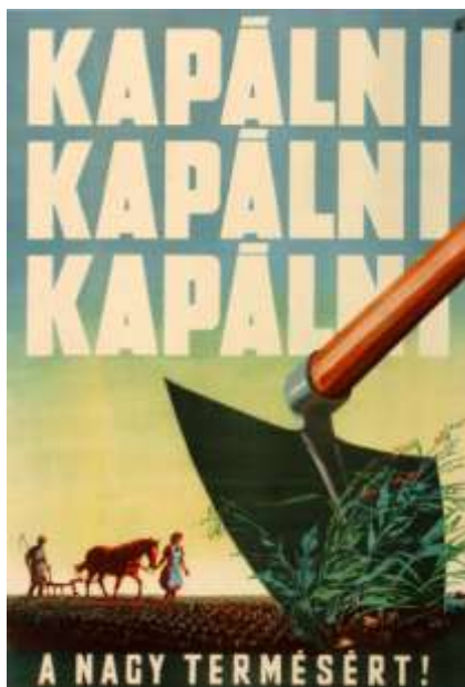
Propaganda plakát, buzdító szöveg a beszolgáltatásra 4

1948. június 12-én megalakult az MDP (Magyar Dolgozók Pártja), élén Rákosi Mátyással. Az új párt a Magyar Kommunista Párt és a Szociáldemokrata Párt egyesülése révén jött létre. A két párt levonta azt a következtetést, miszerint a kommunizmus megvalósításában nem járhatnak külön utakon és a szovjet példa az élet minden területén követendő. Ennek jegyében olvadt össze a két párt, és elkezdte Magyarország életének, politikájának, gazdaságának és társadalmának szovjet mintára történő átalakítását. A megalakult egységes munkáspárt rövidesen felszámolta a többpártrendszert és már leplezetlen, nyílt, kommunista diktatúrát vezetett be. Az MDP célul tűzte ki a mezőgazdaság paraszti kisbirtokra épülő termelését, a kisipar bekapcsolását a tervgazdálkodásba, a magánkereskedelem bekapcsolását a tervgazdálkodásba, valamint a szociális biztonság fokozását. Mindez azt jelentette, hogy a parasztnak még többet kellett termelni, a földeket be kellett szolgáltatni a termelőszövetkezetekbe, és az ellenkező parasztokat meg fogják hurcolni. 3