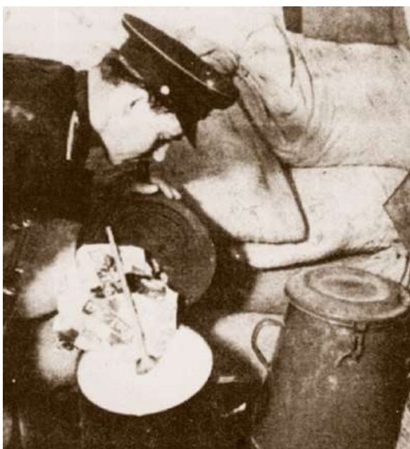
A képen: elrejtett élelmiszer után kutató rendőr 8

tömkelege sújtotta a parasztságot. Céljuk volt a falusi kisbirtokos parasztság felszámolása és ezzel együtt az „ellenség”, a „belső árulók” leleplezése. „Fizessenek a gazdagok” –írta a Szabad Nép. Az 1948/49-es begyűjtési rendelet szerint a 25 holdas gazdáknak háromszor, az 50 holdas gazdáknak négyszer annyit kellett beszo­l­gáltatni, mint a nem kulák gazdáknak. Az 1949-1950. évi beszo­l­gáltatási ren­de­let­tel a termelők köte­le­zettsége 15%-al emelkedett, míg a kulákoknál 40%-al. 7 Ezzel a kulákságot még inkább meggyötörték, akkora terhelést róva a nyakukba, hogy már nem tudták teljesíteni a beszo­l­gáltatást.