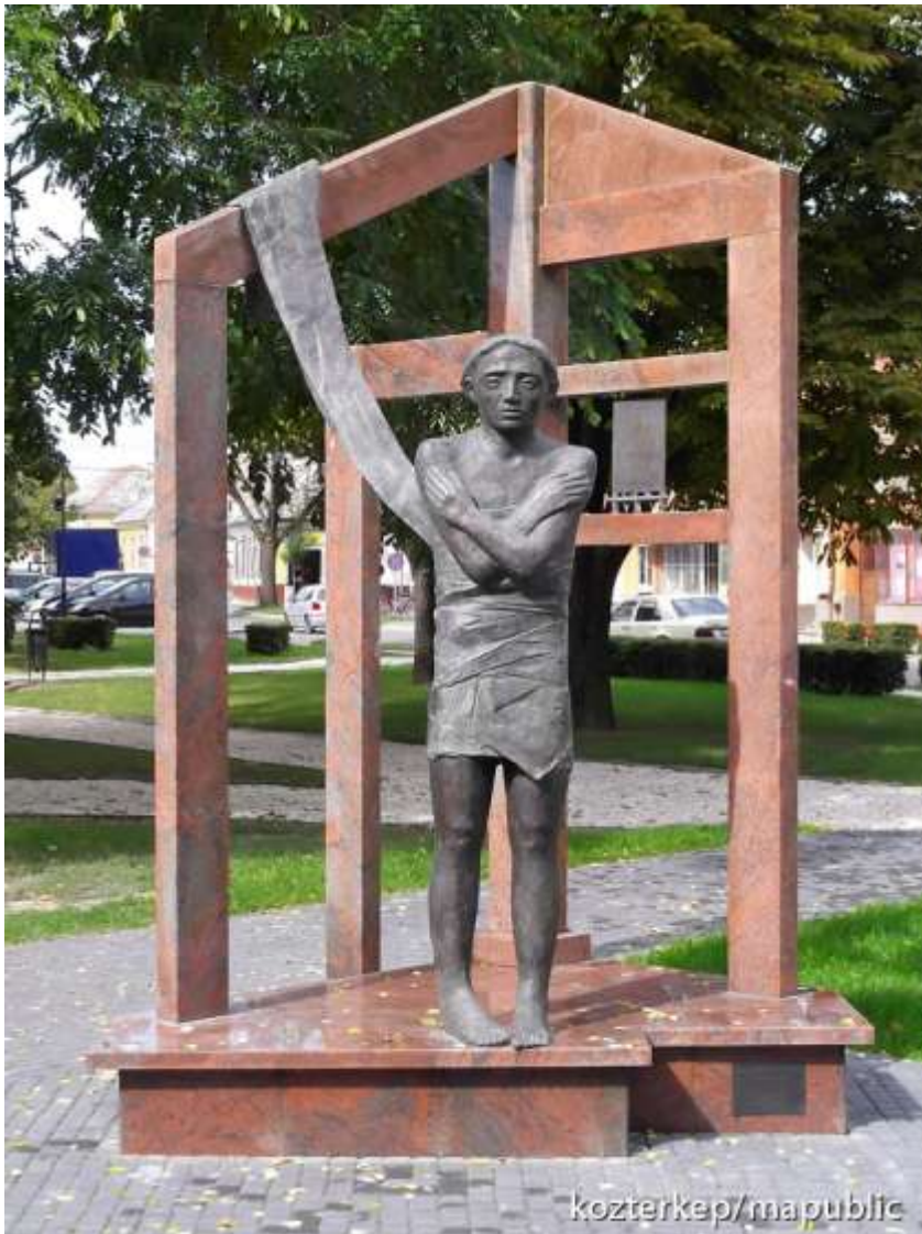
A nagykőrösi szobor 24