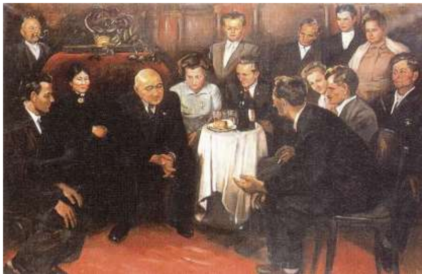
A termelőszövetkezetek I. kongresszusa küldötteinek fogadása a Parlamentben, 1950-ben 6

A termelőszövetkezetek iratai az 1950 utáni falutörténetírás legfontosabb forrásai közé sorolhatók, hiszen a tsz-ek megszakításokkal ugyan, de alapvetően meghatározták a falvak életét. 1990-ig sokszor egyetlen helyi munkalehetőségként döntő befolyással voltak a helyi hatalmi viszonyokra. Meghatározó szerepet töltek be a paraszti kultúra átalakulásában, a tradicionális munkaszervezeti formák és a hagyományos társadalom teljes felbomlásában. Történetük több jól elkülöníthető szakaszra bomlik: Az 50-es évek tsz-mozgalmairól kevés helyi forrás keletkezett, ezek inkább a különböző szintű tanácsi iratokból rekonstruálhatók, a hatvanas évektől viszont a tanácsi iratok már inkább kiegészítői egy-egy falu több, majd egyetlen tsz-ének történetéhez, míg végül, a hetvenes években beköszöntött a több falut magába foglaló mezőgazdasági nagyüzemek korszaka.