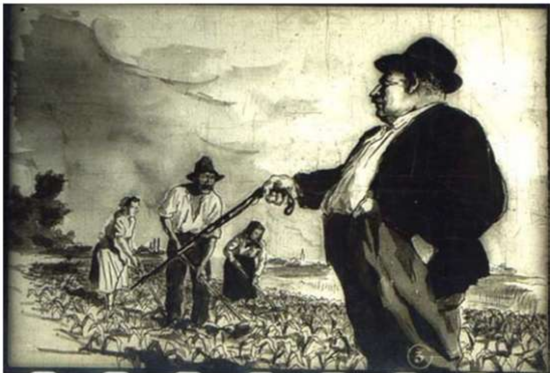
2. Ádáz ellenségünk a kulák