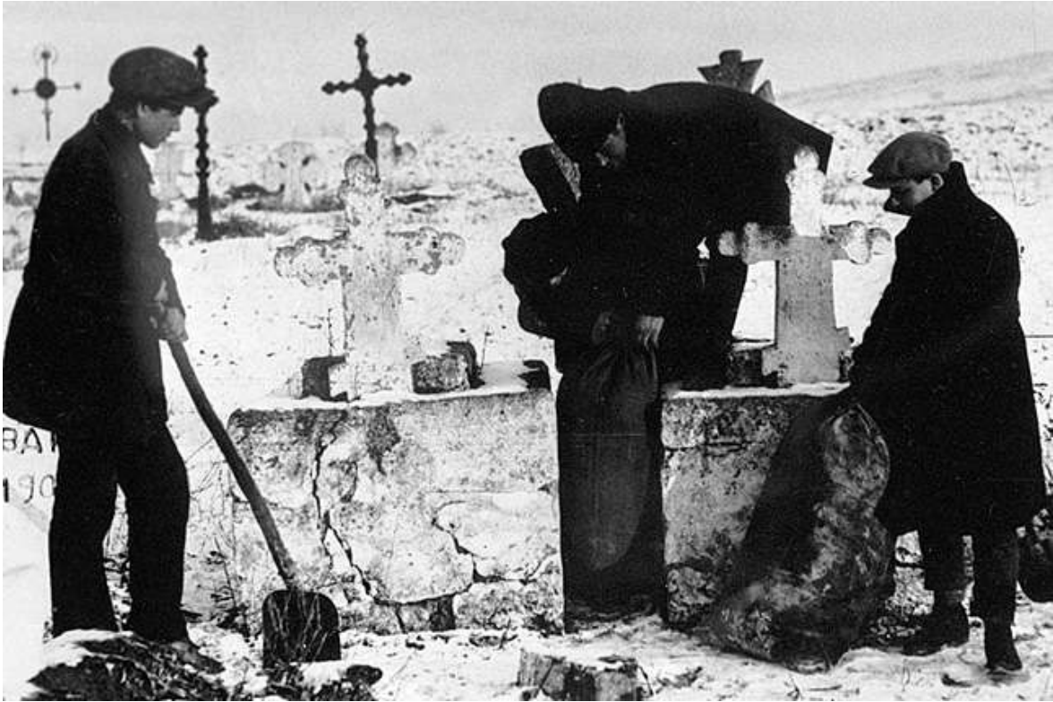
3. Élelem elrejtése